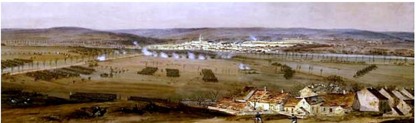
Bataille de Château-Thierry, 12 février 1814, trois heures de l'après midi (détails). Jean Antoine Siméon Fort

* : Cosaques du Don de Karpov II & Sementchikov IV/**: Cosaques du Don de Lukowkin II & Kutenikov IV/***: Cosaques de Grekov et 2 ème rgt de Kalmucks