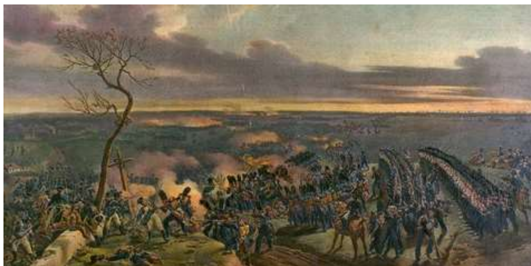
Bataille de Montmirail, lithographie d'après le tableau de Horace Vernet.