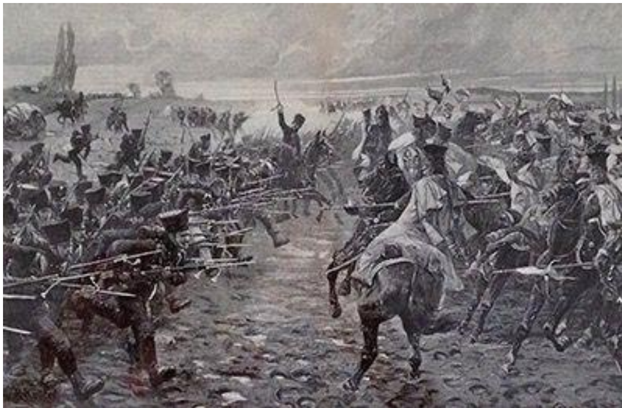
La charge des Schützen à Vauchamps.- R. Knötel

NB : Blücher commande Prussiens et Russes, il peut leur donner des PC à chacun.