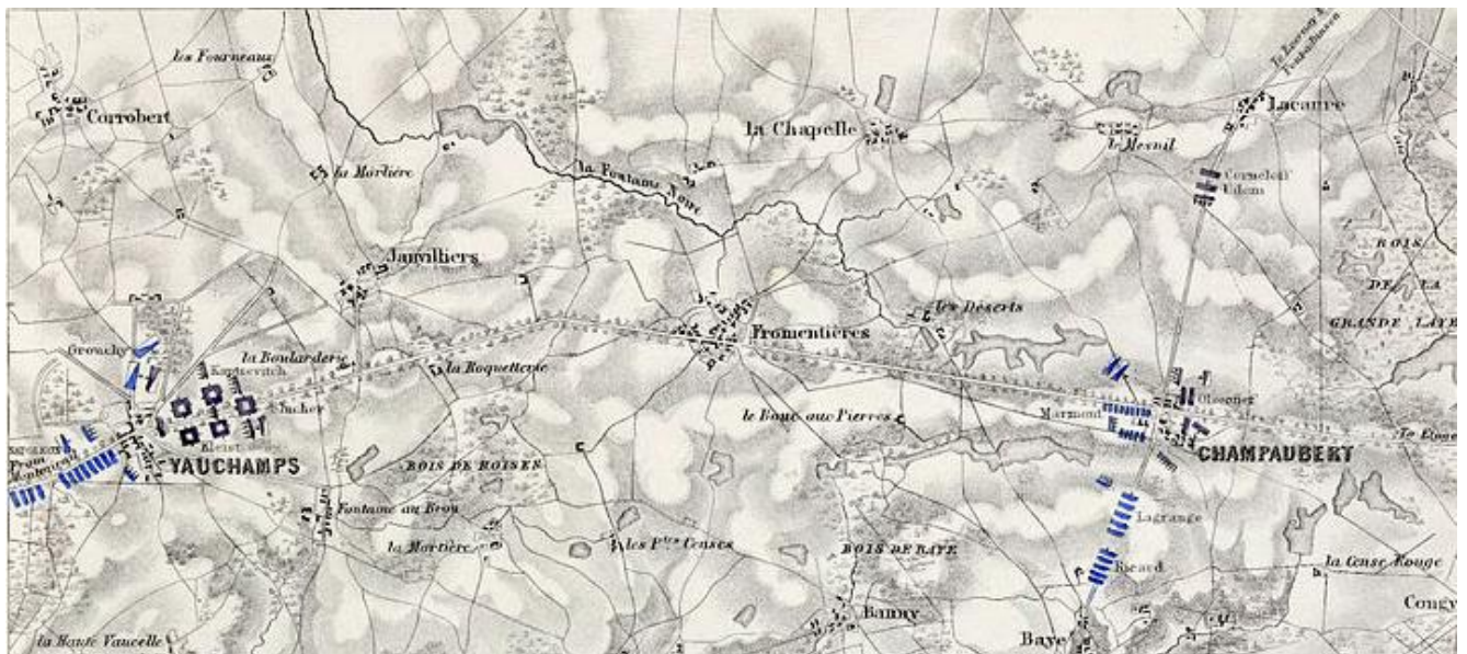
Bataille de Vauchamps (14 février) et Champaubert (10 février), Atlas of Alison's History of Europe, 1863 par Johnston, Alexander Keith, 1804-1871, Alison, Archibald, Sir, bart., 1792-1862