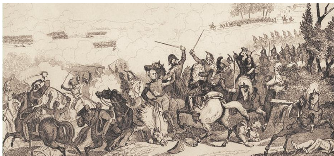
Combat de Vauchamps, Gravure de Jean-Baptiste Réville

18 Unités dans l'armée Budget Total : 192